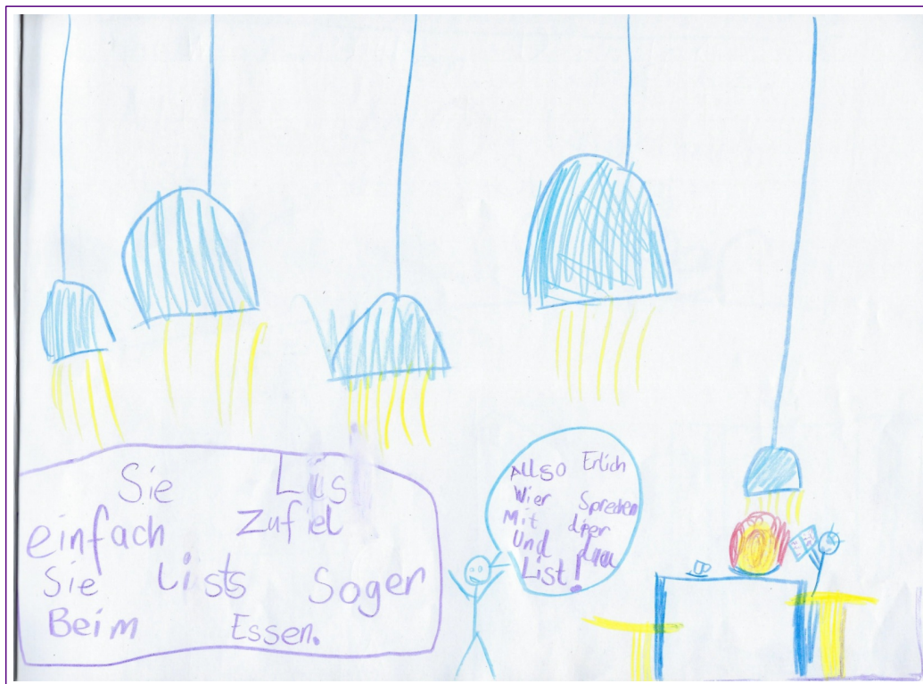
Sie las einfach zu viel. Sie las sogar beim Essen. „Also ehrlich, wir sprechen mit dir und du liest!“