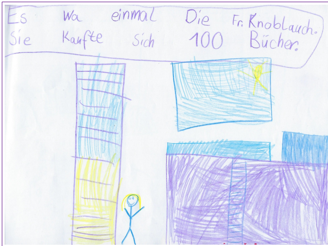
Es war einmal Frau Knoblauch. Sie kaufte sich 100 Bücher.