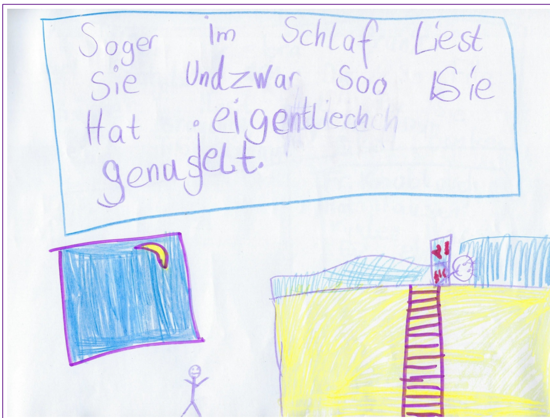
Sogar im Schlaf liest sie. Sie hat eigentlich genuschelt.